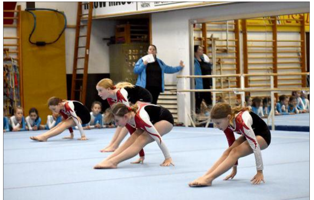
In Amel trafen sich 136 Turnerinnen und Turner zum Mannschaftskampf in fünf Disziplinen.

In vier Alterskategorien traten die Mädchen gegeneinander an. In der Kategorie 1 behaupteten sich im Bodenturnen der TSV Rocherath 1 und der TSV Heppenbach 1 am besten. Sie gewannen diese Disziplin. Ihre jeweils zweiten Mannschaften entschieden das Tauziehen für sich. Im Pedallo-Fahren setzte sich der TSV Honsfeld durch, genauso wie beim Hindernislauf und im Sackhüpfen. Der TSV Honsfeld siegte in der Kategorie 1. In der Kategorie 2 war der TSV Büllingen unschlagbar: Vier der fünf Disziplinen gingen an sie. Lediglich im Tauziehen mussten sie mit einem zweiten Platz Vorlieb nehmen. In der Kategorie 3 ging es zwischen dem TSV Rocherath 1 und dem TV Weywertz 1 spannend zu. Beide Teams gewannen zwei Disziplinen. Nur