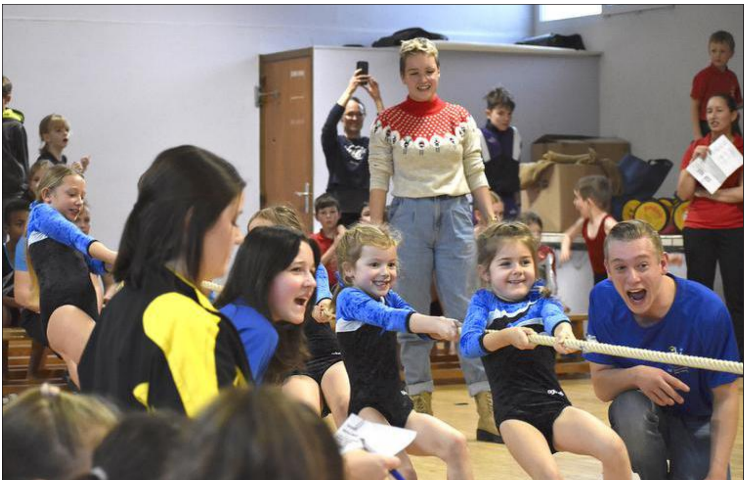
Volle Begeisterung herrschte unter anderem beim Tauziehen zum Beginn der Turnsaison.