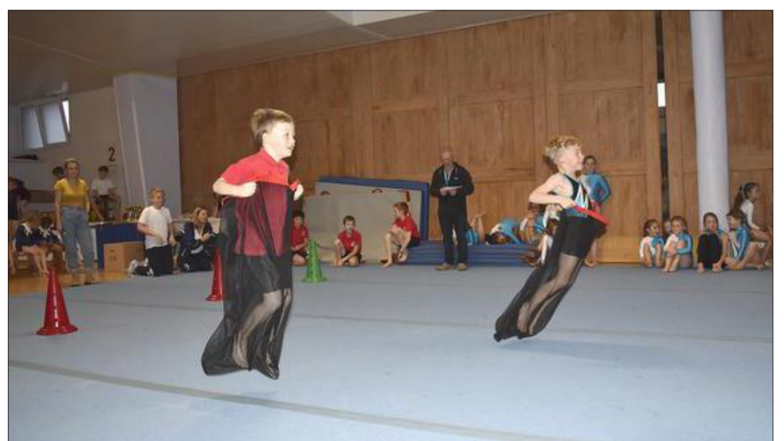
Auch Sackhüpfen gehörte zu den Disziplinen.